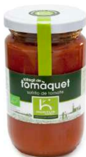
Sofregit de tomàquet

Sofrito de tomate Tomato sauce "sofrito"